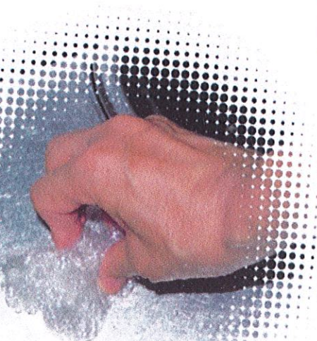
シンク磨きを利用