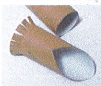
掃除機のノズルとして利用